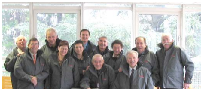
La photo de fin d'AG