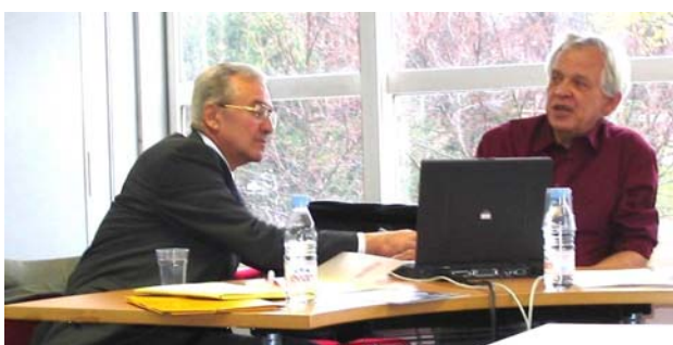
Concertation ou problème technique ?

Le tableau récapitulatif de la situation financière du Cercle a été remis à tous les participants. Quitus unanime des comptes a été donné au trésorier.