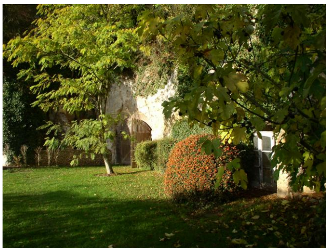
Les caves en tuffeau abritent les travaux intérieurs du jardinier

Promenades pour visiteurs - Nous aimons partager cet émerveillement de la diversité du vivant avec les visiteurs à qui nous proposons des promenades botaniques guidées, tous les sens en alerte. L'accent est porté sur une connaissance multi sensorielle des plantes et les équilibres écologiques de tout l'écosystème. Il s'agit d'identifier les espèces par le toucher des feuilles, par l'odeur des aiguilles, par une observation raisonnée des silhouettes, des écorces, des fleurs et des fruits. En deux heures, les visiteurs