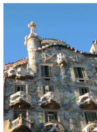
La Casa Batlló, œuvre de Gaudi à Barcelone