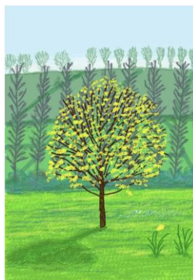
« Le pommier » © David Hockney (2020)