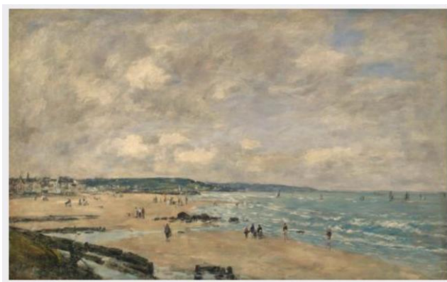
« La plage à Trouville » d'Eugène Boudin (1893)

Un peu plus à l'intérieur des terres, c'est dans un des plus beaux villages de France, Beuvron-en-Auge, que s'est installé pour sa retraite le célèbre peintre britannique David Hockney. Arrivant de Los Angeles, lui aussi est tombé amoureux du pays normand et de ses lumières. Pendant le confinement il a retranscrit sur son iPad (c'est un passionné de technologie) les émotions ressenties à l'approche du printemps, sujet qui lui est cher depuis toujours. Une exposition à New York l'été dernier a relaté tout ce travail normand.