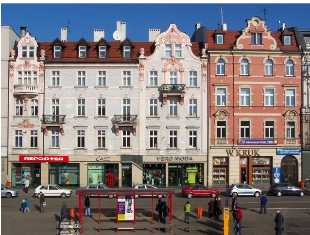
Façades traditionnelles à Katowice : 35 Masters et 26 conjoints espèrent visiter Sopra Steria Pologne en septembre, si la Covid veut bien.