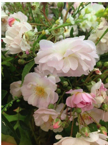
La rose Henrienne, rosier buisson très légèrement parfumé.