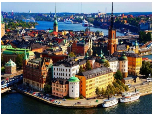
71 Masters et conjoints se sont inscrits pour visiter Stockholm en juin.