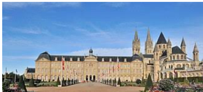
Caen : Abbaye aux Hommes