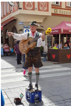
A gauche : « Guitariste bavarois » de Françoise Thélot .